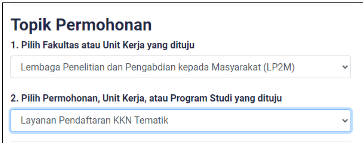
Gambar Topik Permohonan yang dituju untuk Pendaftaran KKN Tematik